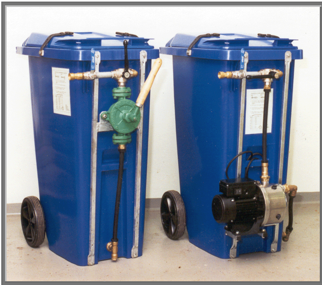
Bilden visar HANS 200H och HANS 200E

Kärlet är tillverkat i formsprutad uv stabil polyeten som klarar temperaturer mellan -40 och +80 grader c.